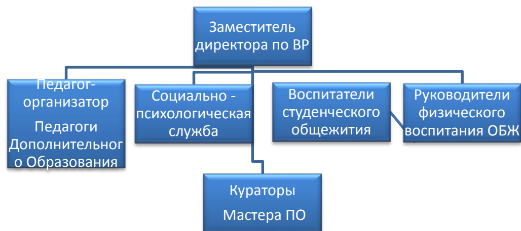
Структура воспитательной работы

В основу функционирования системы воспитания и внеурочной деятельности обучающихся положены стратегические документы, определяющие приоритетные формы и содержание воспитательной деятельности, отвечающие современным потребностям рынка труда в квалифицированных рабочих кадрах и запросу государства и общества по отношению к личности и гражданской позиции: Концепция общенациональной системы выявления и развития молодых талантов, Стратегия развития воспитания в Российской Федерации до 2025 года, Стратегия молодежной политики до 2025 года. Положение «О материальной поддержке студентов в КГБПОУ «Таймырский колледж». Положение «О социально-педагогической службе в КГБПОУ «Таймырский колледж». Положение «О системе профилактической работы в КГБОУ «Таймырский колледж». Положение «О Совете профилактики в КГБПОУ «Таймырский колледж».